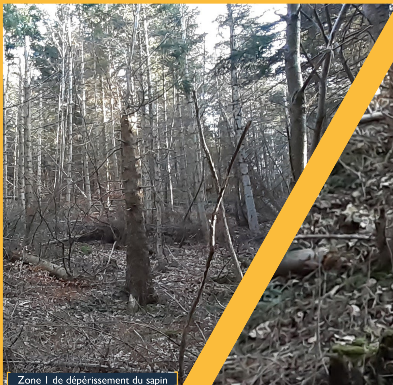
Zone 1 de dépérissement du sapin

Sur ces zones où le sapin est en fort dépérissement et condamné, où la dynamique de végétation naturelle n'est pas suffisante (ou inexistante), dans le cadre du plan d'Aménagement Forestier, une dizaine d'Îlots d'Avenir vont être créés dans les 5 ans à venir (2023 -2028).